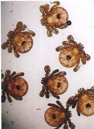
フタトゲチマダニの幼虫

ダニの弟子のS君に「ダニを何万匹も殺した祟りかねえ」というと、「違いますよ。それは先生がダニの研究をやめて甲虫の採集に没頭し始めたから、ダニが恨んだんですよ」と。