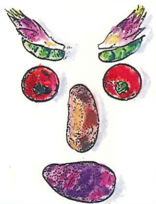
コンテスト入賞作「野菜顔」

この方法ではデジタルカメラで撮影できるものは何でも簡単に絵にすることが出来ます。