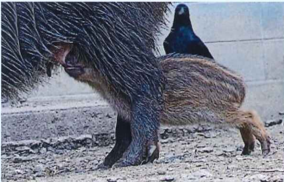
山のカラスも見に来てくれるし、小僧迫は賑やかな正月になった。

母ちゃんは、鼻面で私の車のリヤバンパーをゆすって、私に「来た」ことを知らせ、「プブ」と合図してウリノコを呼び寄せ、私に見せて呉れた。