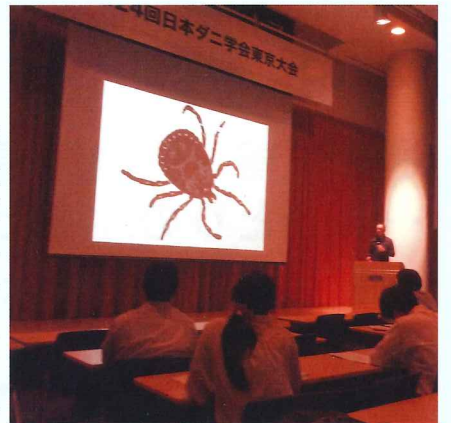
▲第24回日本ダニ学会

ダニ類研究会(1973年設立)が発展的に解消し、1992年1月に発足しました。医学・公衆衛生学・獣医学・農学・理学といった学問分野にとらわれず、ダニ学の