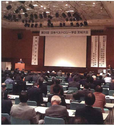
▲第31回日本ペストロジ学会

PCOのための学問を模索し、その技術体系を作りあげることをめざして、1985年に設立され、毎年研究発表大会の開催と年2回学会誌を発行しています。