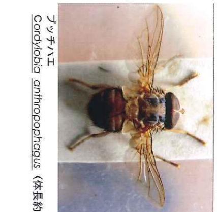
ツツチハエ Gordylobia anthropophagus (体長約8mm)