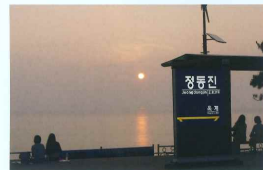
正東津駅の日の出

「世界一海岸に近い駅」としてギネスに登録されていて、駅構内が海岸に続いている。トンネル(東海II日本海)から昇る日の出を見る人で込み合っているが、駅から離れると海岸線は兵士のいる監視小屋と鉄条網が続いており、緊迫する北朝鮮情勢が感じられる。