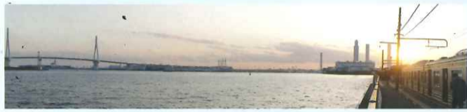
京浜運河(元は海だった…今も海?)に面した海芝浦駅と鶴見つばさ橋